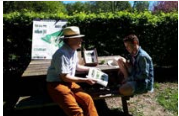
Open tuinen dagen met uitleg en rondleiding