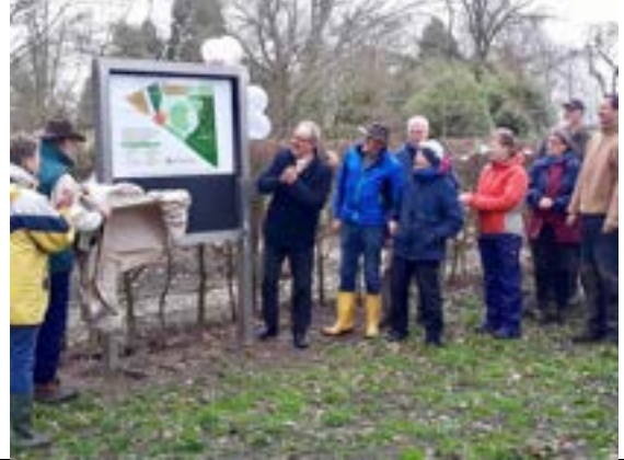
Borden met uitleg en uitgifte folders