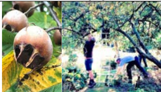
Mispels en kweeperen oogsten