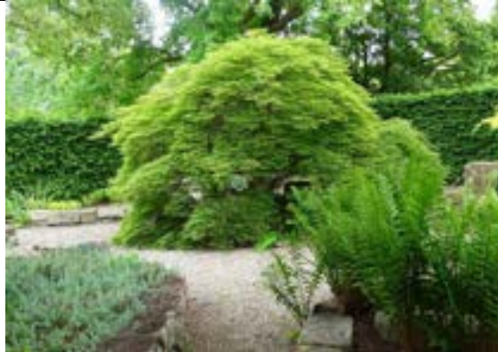
Schone paden en stenen, klaar voor nieuwe inplant