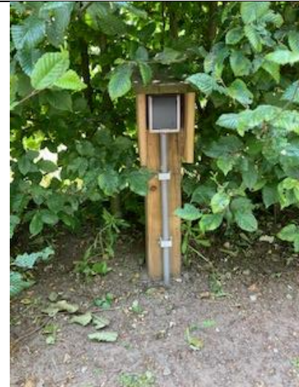
Veel gereedschap is nu elektrisch