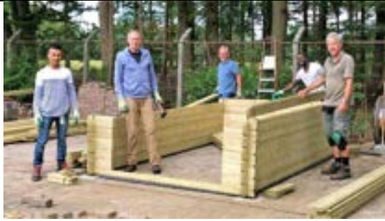
Schuur voor gereedschap