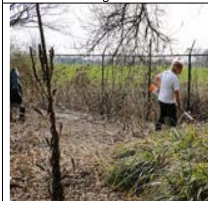
Verwilderde tuin, overgroeid