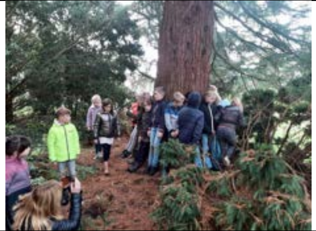
Praktijk lessen van scholen