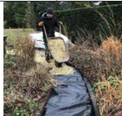
En in gebruik; paden vernieuwd