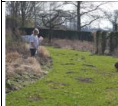
Slecht onderhouden tuin en gras met gaten