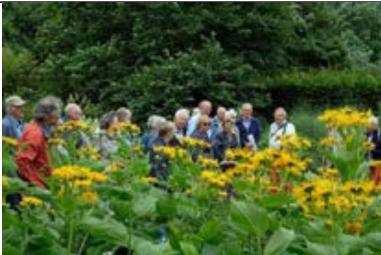
Diverse rondleidingen gehouden