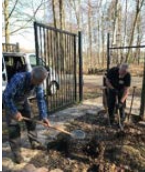
Betere toegang, aansluiting wandelpaden