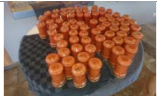
Maakt heerlijke jam en likeur