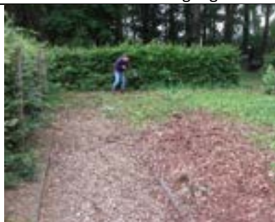
Lege, overwoekerde groentetuin