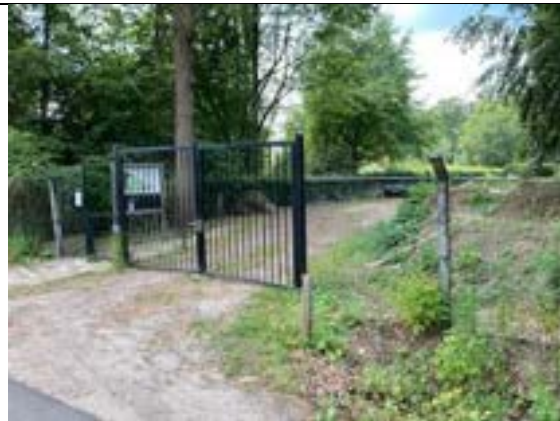
Schone ingang, nieuwe voetgangeringang