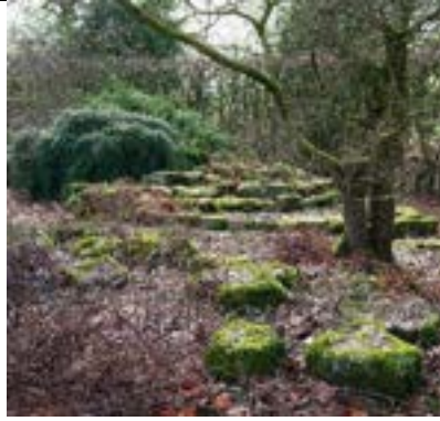
Rotstuinovergroeid, verwilderd, paden bedekt onder troep van jaren