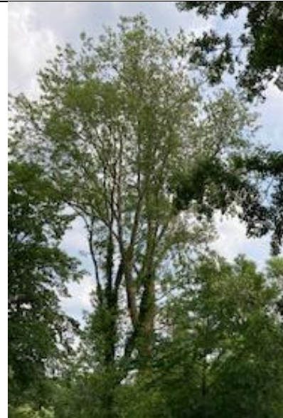
Gekapt, ruimte voor andere bomen