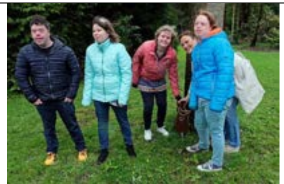
Met hulp van "De Ster" gemaakt