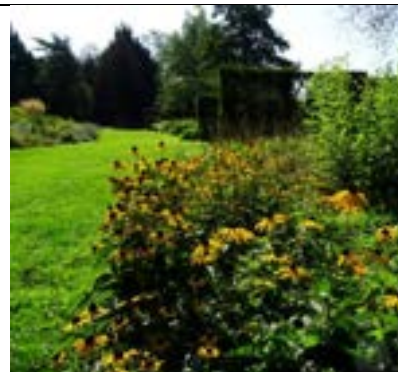
Beter gras, betere hagen en bloei weer zichtbaar