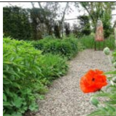
Pad weer begaanbaar, geschoond