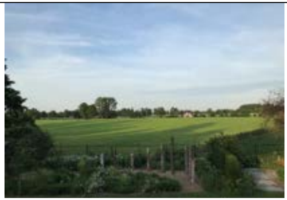
Met mooi uitzicht