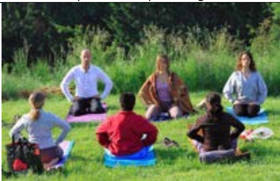
Yoga groepen in de tuin