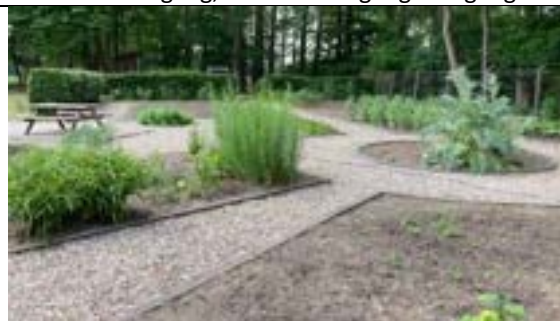
Groentetuin met mooie opbrengst