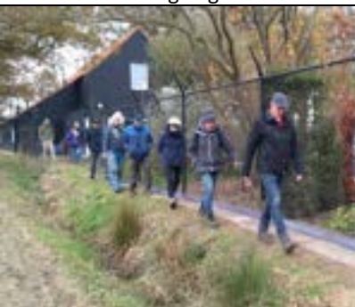
Ook buitenzijde aangepakt