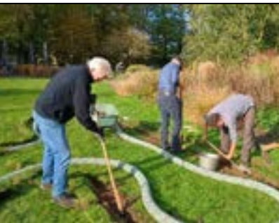
Gras en hagen goed; drainage aangelegd